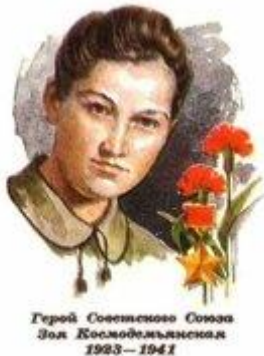
Герой Советского Союза Зоя Космодемьянская 1923—1941

Объявляется Минута молчания. Звучит метроном.